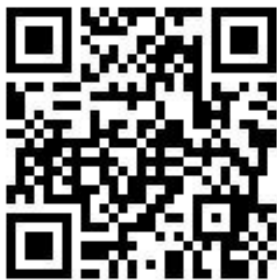
▲ metode lipat